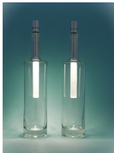
Modèle BOT08-k, avec lumière blanche