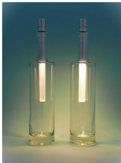
Modèle BOT08-w, avec lumière blanche-chaud