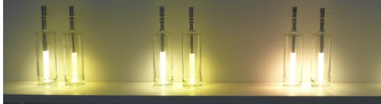
BOT02-k: weißes Licht