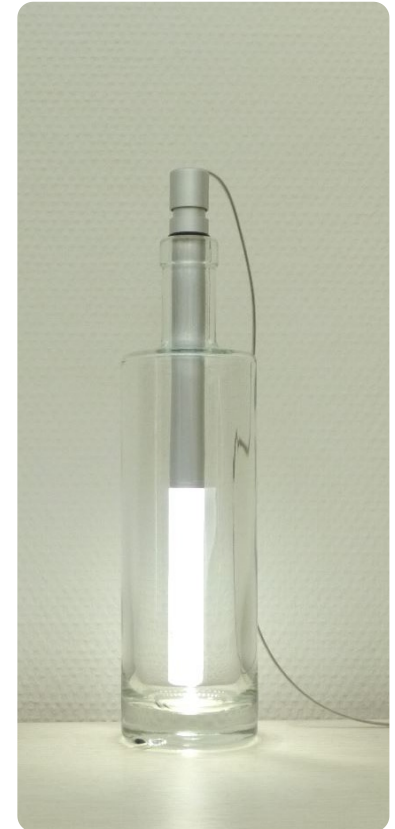
BOT02, BOT03, BOT04 or BOT05 mit/with BOT06