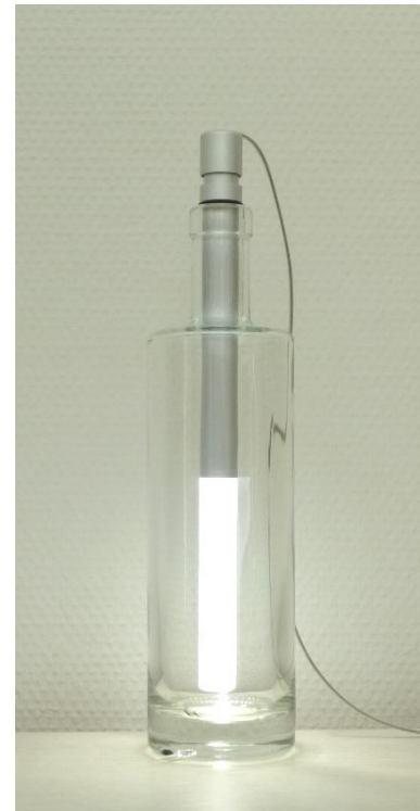
Flaschenleuchte BOT02 - BOT05 mit Batterieersatzmodul BOT06